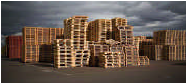
Photos de Gilles Danger et d'Alain Chudeau bientôt en vente pour décorer vos bureaux