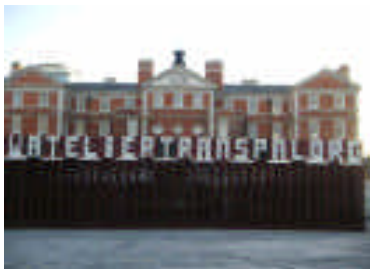
Londres 1 Novembre 2007

Le photographe Gilles Danger a continué son magnifique travail de photos de palettes présenté sur le site planetpal.net